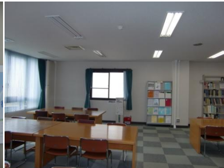
3階閲覧室（留学生・地域医療）