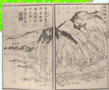
『日本勝地／山水奇観』