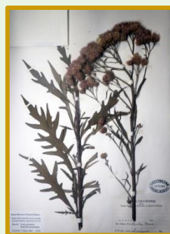
タネの生存が確認された 最も古いヒメヒゴタイの標本(大阪府産1925年採集) ヒメヒゴタイは大阪府では既に絶滅