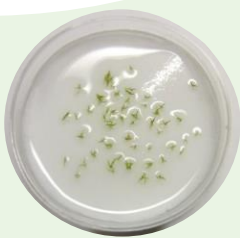
標本のタネから発芽した ホシクサ