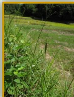
スズサイコ