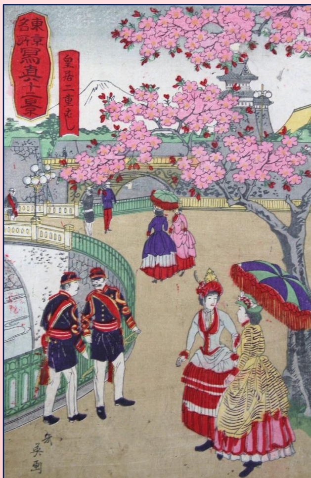
小林幾英画『東京名所写真十二景』「皇居二重ばし」