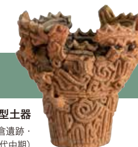
火焰型土器 (長岡市石倉遺跡・ 縄文時代中期)