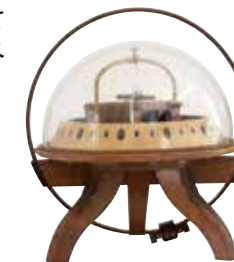
正接検流計 磁針の振れ幅の角度で 電流を測定 (旧制新潟高等学校)