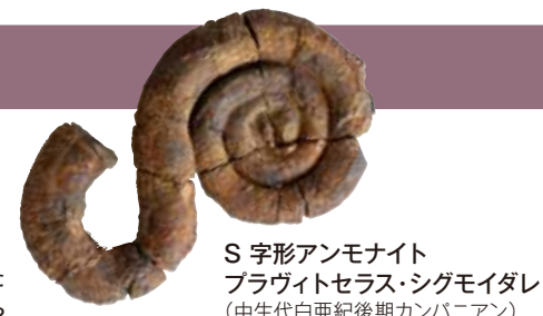
S字形アンモナイト プラヴィトセラス・シグモイダレ (中生代白亜紀後期カンパニアン)

新潟大学の前身である旧制学校時代に使用された実験機器のほか、歯科医療の歴史をたどる資料や県内のジオパークに関連する資料などを展示しています。また、災害・復興科学研究所による国内外の自然災害についての調査成果も紹介しています。