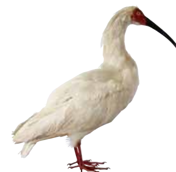
トキ剥製 1961年五泉市で採集 成鳥(オス)