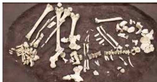
佐渡市堂の貝塚 第6号人骨 (縄文時代中期・ 新潟県指定文化財)