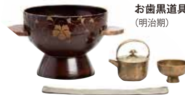
お歯黒道具 (明治期)