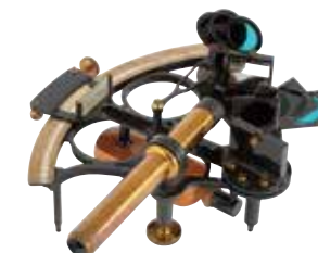
六分儀 航海中に天体の 高度を測定 (旧制長岡高等工業学校)